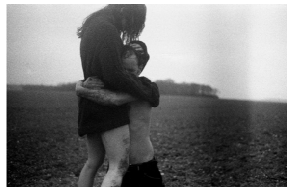
© Alice Marie Brigitte, What is past is prologue Troisième prix du jury, édition 2022